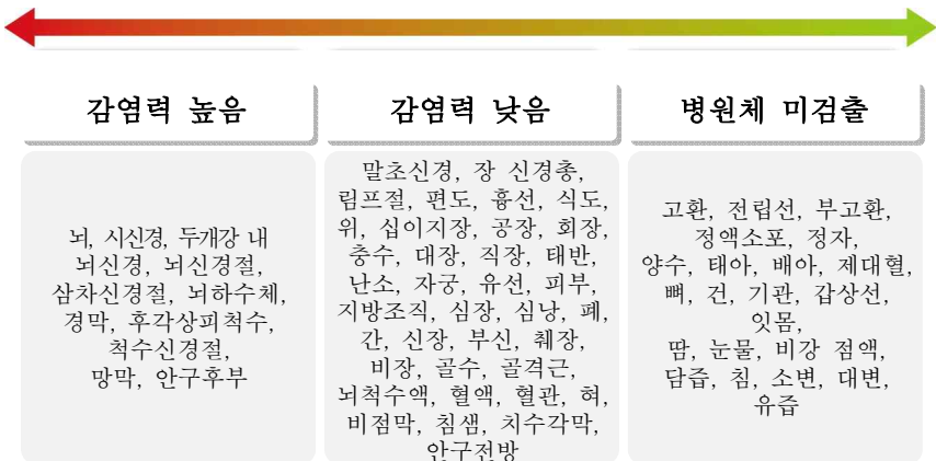
그림 1 | 인체 조직 부위별 감염력 비교

※ 감염력이 없는 검체(타액, 외분비물, 대·소변 등)에 대한 특별관리 불필요