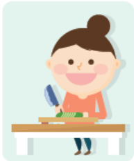
올바른 영양 및 식생활 관리 방법